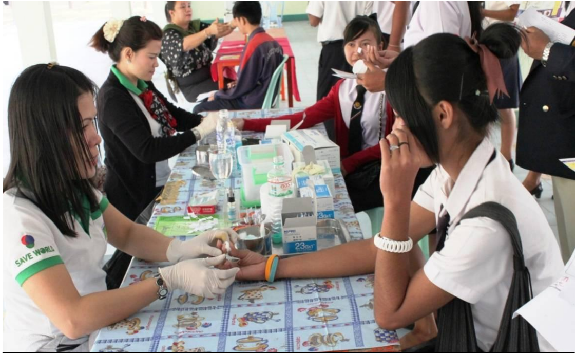
นักเรียน นักศึกษา เข้าร่วมบริการ ตรวจสอบสารเสพติด