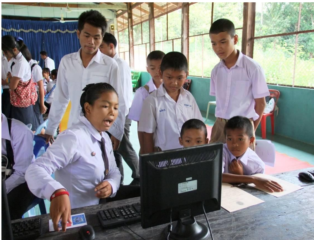
นักศึกษา ได้ใช้ทักษะด้านการเรียน แนะนำการใช้เทคโนโลยีที่จำเป็นในการศึกษา ค้นคว้า และปฏิบัติงาน พร้อมสอนวิชาชีพให้กับน้องๆ นักเรียนผู้สนใจ