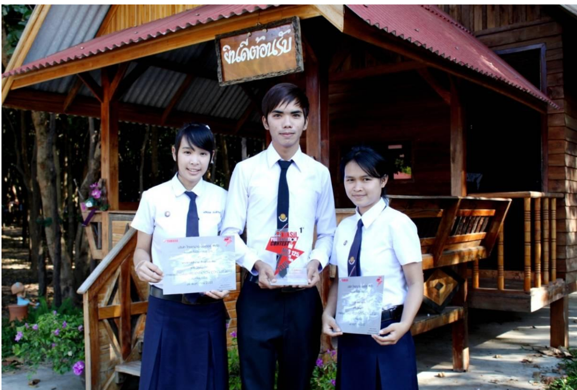
นักเรียน นักศึกษา ได้เข้าร่วมการแข่งขัน Diasil Presentation Contest 2010 ในวันที่ 26 พฤศจิกายน 2553