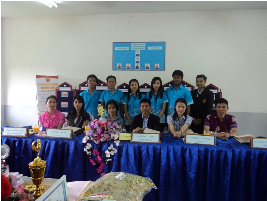
แผนกวิชาการบัญชีเข้ารับการตรวจการประกันคุณภาพภายในที่ก่อให้เกิดการพัฒนาแผนกและสถานศึกษา