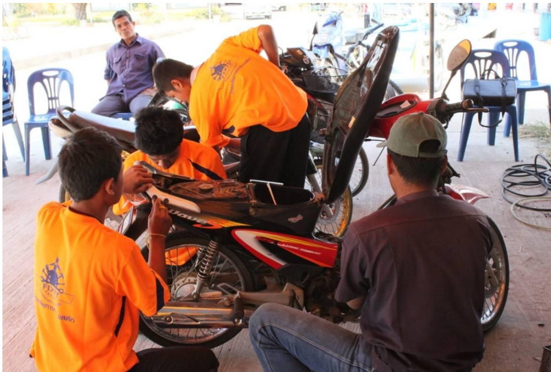
นักเรียน นักศึกษา เข้าร่วมโครงการ Fix iT CenTer เป็นผู้ให้บริการวิชาชีพในการพัฒนาชุมชนและท้องถิ่น