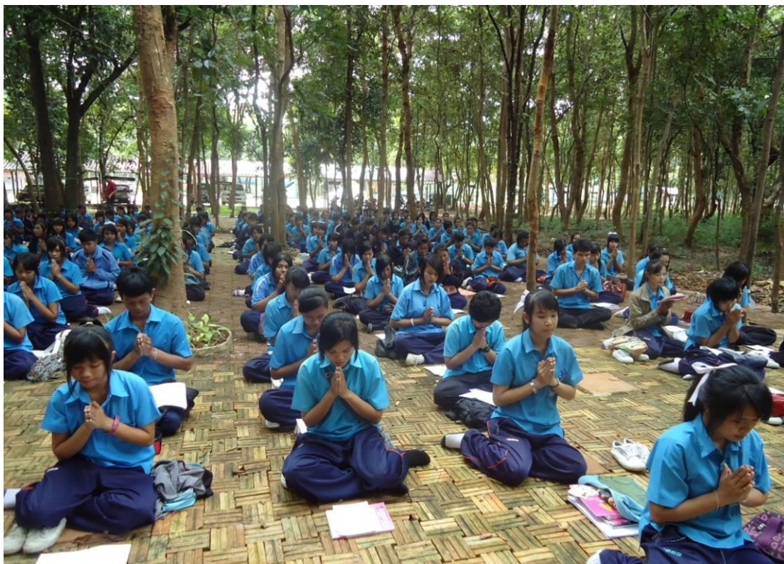
มีการส่งเสริมนักเรียนนักศึกษาในด้านการจัดกิจกรรมคุณธรรม จริยธรรม ค่านิยมที่พึงามในวิชาชีพ รวมทั้งด้านบุคลิกภาพและมนุษยสัมพันธ์ ในคาบพัฒนาจิต