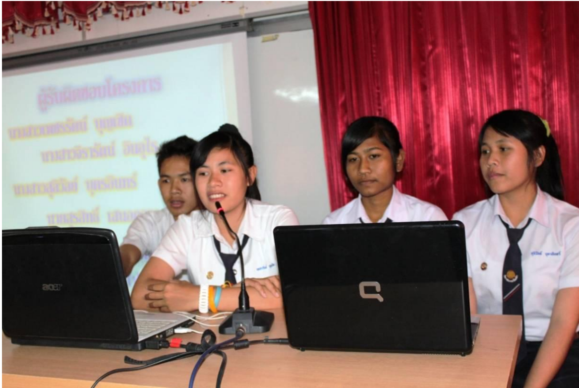
นักเรียน นักศึกษา เข้าร่วมการนำเสนอผลงานโครงการวิชาชีพ (Project)