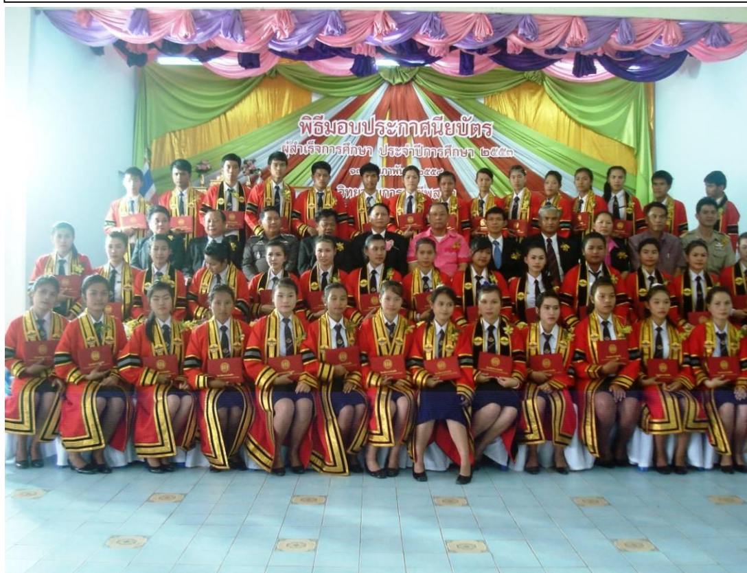
ผู้สำเร็จการศึกษาที่มีผลสัมฤทธิ์ทางการเรียนตามเกณฑ์การสำเร็จการศึกษา ตามหลักสูตรประกาศนียบัตรวิชาชีพ