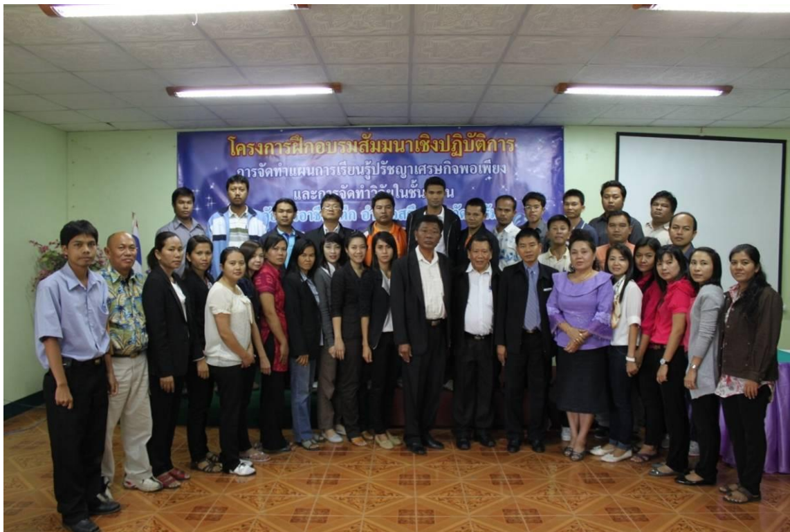
ส่งเสริมครู บุคลากรทางการศึกษา เข้าร่วมโครงการฝึกอบรมสัมมนาเชิงปฏิบัติการ การจัดทำแผนการเรียนรู้ ตามหลักปรัชญาเศรษฐกิจพอเพียงและการจัดทำวิจัยในชั้นเรียน