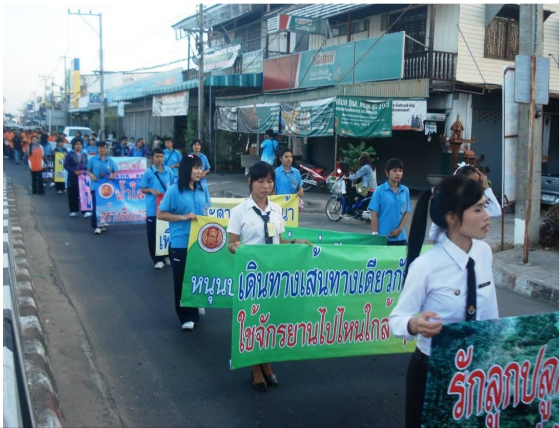
นักเรียน นักศึกษา ร่วมกิจกรรม เนื่องในวันแห่เทียนเข้าพรรษา ร่วมกับเทศบาลอำเภอสตึก จังหวัดบุรีรัมย์