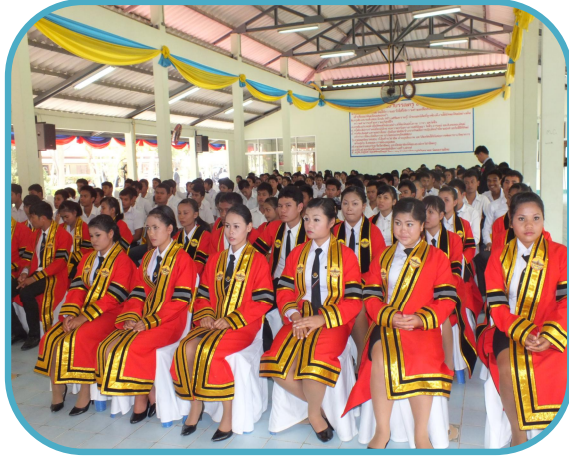
ผลผลิตที่ 1 ผู้สำเร็จการศึกษาระดับประกาศนียบัตรวิชาชีพ (ปวช.)