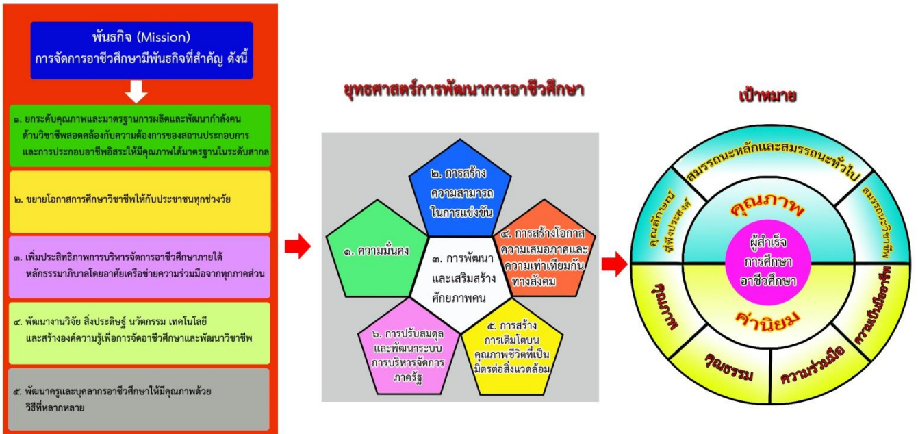
ภาพที่ ๒ ความเชื่อมโยงสาระสำคัญของแผนพัฒนาการอาชีวศึกษา พ.ศ. ๒๕๖๐ - ๒๕๗๙